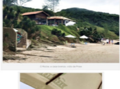
O Hotel, a casa perfeita para o fim de semana