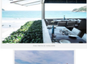
Uma vista linda do restaurante