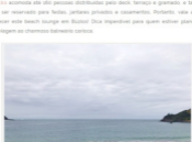
Certamente um dos melhores locais de Praia Brava

O Rocka acomoda até 150 pessoas distribuídas pelo deck, terraço e gramado, e também pode ser reservado para festas, jantares privados e casamentos. Portanto, vale a pena conhecer este beach lounge em Búzios! Dica imperdível para quem estiver planejando uma viagem ao charmoso balneário carioca.